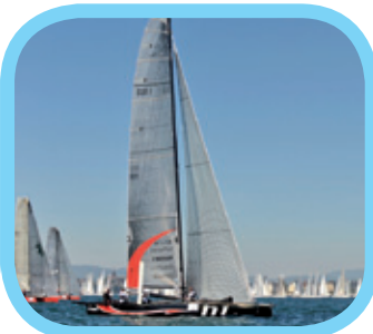
Le lac Léman

Le lac Léman se situe entre la France et la Suisse. La frontière passe au milieu du lac. C'est le plus grand lac d'Europe. Chaque année, une importante compétition de voile a lieu sur le lac, au mois de juin.