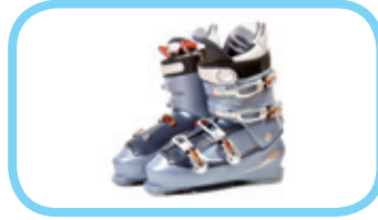
des chaussures de ski