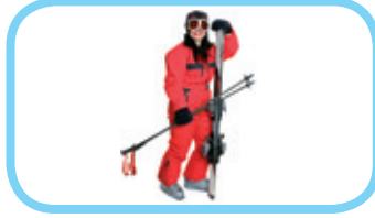
une tenue de ski