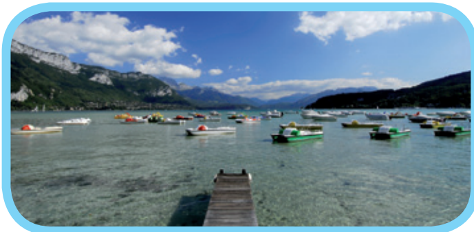
Le lac d'Annecy